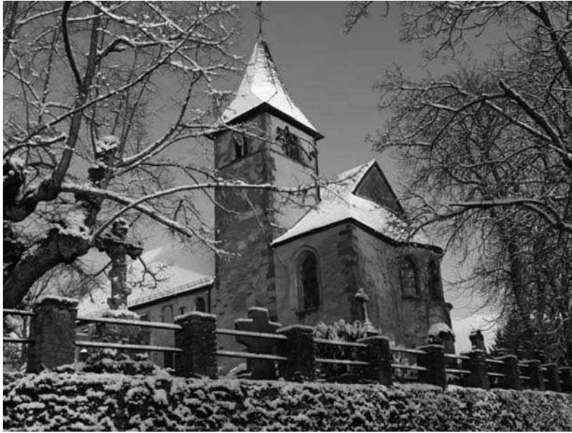
AFB. 34 – In de romaanse basiliek van Roth werden de missen gelezen door de tempeliers, die heersten over de volledige linkeroever van de Our en over de kapel Saint-Nicolas.