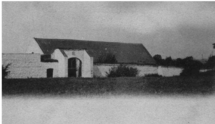
AFB. 33 – De 'Ferme de la commanderie' van Piéton, nabij Chapelle-lez-Herlaimont.

Even ten zuiden van Mons, nabij Frameries , waren de tempeliers aanwezig in het plaatsje Le Fliémet, waar ze in 1142 grond kregen van graaf Boudewijn IV van Henegouwen. De graaf bleef de broeders van 'Le Fliémet' of Flumé steunen, die hun