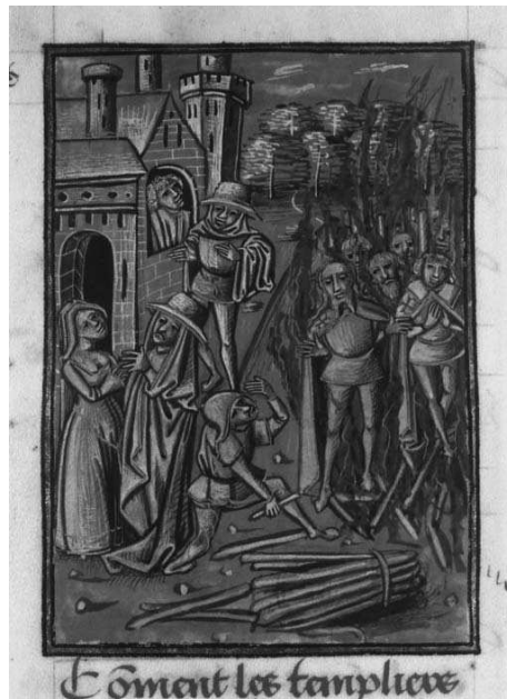
AFB. 37 – Terechtstelling van de tempeliers. Afbeelding uit de kroniek van Boudewijn van Avesnes uit de veertiende eeuw.

In Winnezele hadden de tempeliers een huis waar nu de 'Hameau du Temple' terug te vinden is. Net als in Le Grand Mesnil en in La Haie, mocht de commandeur van tempeliers er rechtspreken over de inwoners van het gebied. Vlakbij het huis hadden de ridders een kapel gebouwd, die nu verdwenen is. De Tempel van Winnezele had belangen in Zemerzele en Arneke. Verschillende dorpen, zoals Houdezelle, Hondeghem, Linden en Steenvoorde waren schatplichtig aan de ridders. In Wormhoudt hadden de broeders een huis met een klein domein. In Mardyck hadden de tempeliers van Ieper renten nabij Duinkerke en even verderop in Bergues . 69 In de voorstad van Valenciennes, in het plaatsje Beaulieu , hadden de tempeliers een grote hoeve met kapel. Meer naar het zuiden was er het Tempelhuis van Avesnes-le-Sec , dat in 1198 na een schenking van Gauthier d'Avesnes in handen van de ridders kwam. Ze bouwden in Avesnes een kapel bij het huis vanwaaruit ze rechtspraken