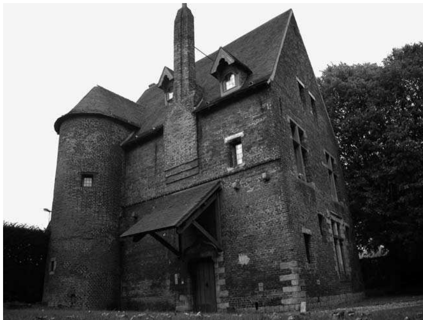
AFB. 36 – Het tempelhuis van Douai.

tempeliers bezaten in Cobrieux lenen in Bure-Manoir en op de weg van de kerk naar de 'Bois de la commanderie'. Ze hadden lenen te Englebert, nabij de motte en in Les Dondaines te Genech. Daarnaast telde de commanderie nog een half dozijn niet nader geïdentificeerde domeinen. De tempeliers herbouwden na hun aankomst de primitieve dorpskerk, waarvan een deel nog steeds te zien is. Op hun domein bouwden ze een donjon of een versterkt huis, langs de weg naar de Posterie, vanwaaruit ze rechtspraken over de 160 lijfeigenen die op hun domein leefden. De commanderie van Cobrieux bestaat vandaag niet meer, maar in 1998 werd een loden tempeliersboule gevonden door de amateur-archeoloog Stéphane Berton. Elke commandeur had een boule, waarmee hij een zegel kon maken om documenten en aktes officieel te maken. 65 Vandaag de dag brengt de wandelroute 'Circuit de la commanderie' ons langs de mooiste plekjes van het dorp dat tot aan de vooravond van de Franse revolutie door de orde van Malta werd bestuurd. 66