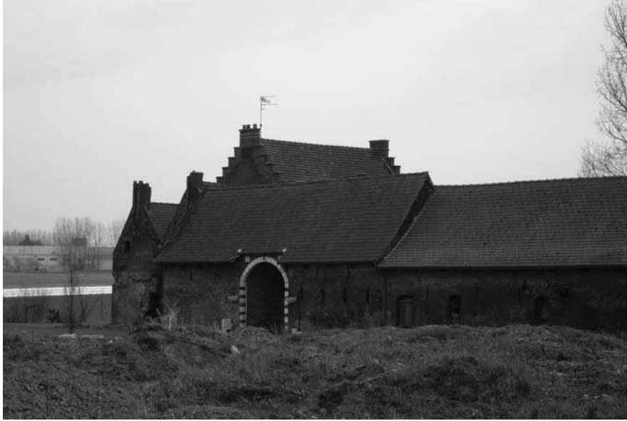
AFB. 35 – De commanderie van Caestre oogt nog steeds indrukwekkend.

nen de stadwallen, was ommuurd en voorzien van een gracht. Na het verdwijnen van de tempelorde, raakten de boerderijen die van Douai afhankelijk waren in verval, op het huis en de kapel van Douai na. De hospitaalridders gebruikten de commanderie vaak als veilig toevluchtsoord tijdens de woelige veertiende en vijftiende eeuw. Nu getuigen het statige huis en de poort van de commanderie nog steeds van de aanwezigheid van de tempeliers en de hospitaalridders in de stad. De bezittingen van de commanderie waren aan het begin van de veertiende eeuw erg uitgebreid. In de stad bezaten de ridders renten op tientallen huizen, maar ook in de omliggende dorpen hadden ze belangen te verdedigen: in Corbehan of Corbehem, Courchielles of Courcelles en Tombes, te Kaillau-pierre, Kiery of Quiery-la-Motte, te Nolzière en te Braye of La Brayelle, te Sartiaux op de weg van La Morse, in Buissoncheaux tussen Croix-Luressot en Eskierchen of Equerchin, te Martinfosse, aan het kruis van Saint-Jakeme, in het kamp van Bougres, tussen Sin en Dichi of Dechy, te Croisette en langs de weg naar Anes. In Lambersart bezaten de ridders een watermolen. De molen, die aan het begin van de veertiende eeuw werd afgebroken, zou later door de hospitaalridders weer opgebouwd worden. 63