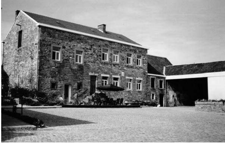
AFB. 32 – De ‘Ferme de la commanderie’ in Modave.

ren door opeenvolgende oorlogen en werden in 1757 afgebroken. Net buiten Huy hadden de tempeliers een huis met kapel in Longpré . 29 Volgens Laurent Dailliez bezaten de tempeliers ook een huis in Luik. 30