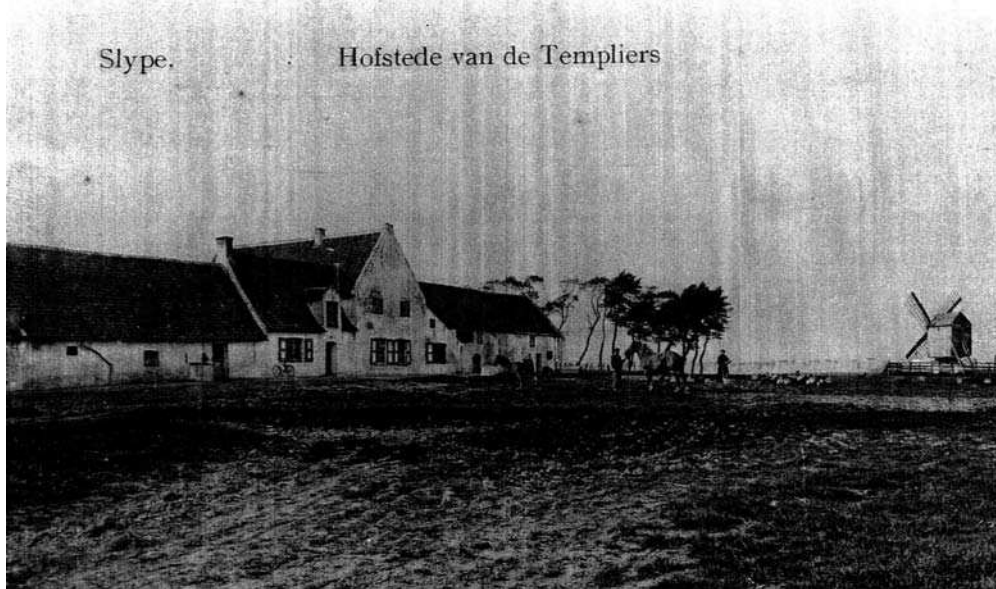
AFB. 31 – Het tempelhof van Slijpe

oosten werden meegebracht. De glasramen zijn niet de enige merkwaardige vondsten. Tijdens de opgravingen werd een dakpan met ingebakken oud molenspel of marellenspel teruggevonden in de opvullingslaag van een ontmantelde steunbeer van de tweede tempelierskapel. Het molenspel was het enige spel dat de tempeliers mochten spelen, evenwel enkel voor het vermaak en niet voor het geld.